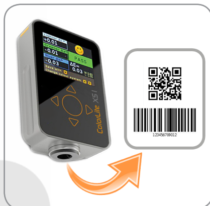
Integrierter QR- und Barcode-Scanner für Proben-ID und Namen

Das kleine Gerät „Made in Germany“ wird aus einem massiven Aluminiumblock gefertigt. Trotz seiner geringen Größe und einem Gewicht von nur 270g ist es mit der allerneuesten Technologie ausgestattet. Die hohe Auflösung ermöglicht eine spektrale Abtastung in 3,5nm-Schritten bei einer Messzeit von unter 1 Sekunde. Die brillante Farbwiedergabe des O-LED Farbdisplays erleichtert dem Benutzer das Ablesen der Daten. Die Menüführung ist einfach und übersichtlich, so dass jedermann den Messvorgang schnell und fehlerfrei durchführen kann. Ein weiteres einzigartiges Merkmal des ColorLite sph xs1 ist die integrierte Data-Matrix und Barcode-Kamera. Diese ermöglicht schnelle Probenerkennung und einfacheres Management.