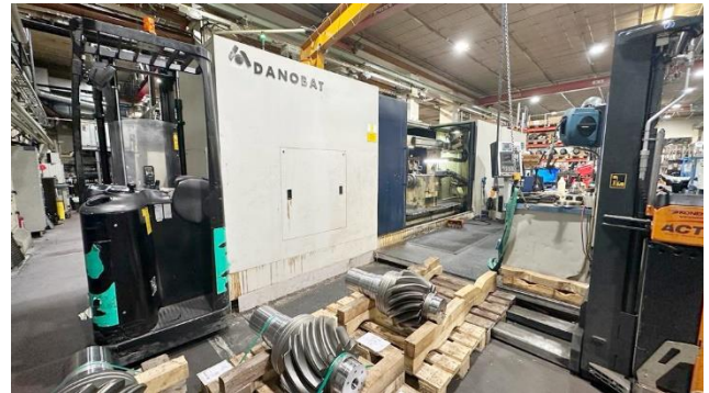
Rectificadora cilíndrica cnc DANOBAT HG 91-3000-B8 Longitud máx rectificado 3000mm Ø máx rectificar: 850mm Control SIEMENS 840D. Muy bien equipada. DANOBAT HG 91-3000-B8 cnc cylindrical grinding machine Max grinding length 3000mm. Max grinding diam. 850mm SIEMENS 840D control. Very well equipped