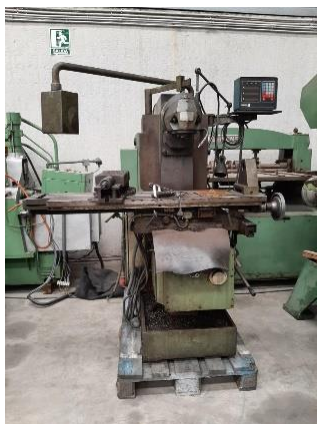
Fresadora MILKO 35R con digitales Recorridos: 860x250x450mm MILKO 35R with read-outs Travels: 860x250x450mm