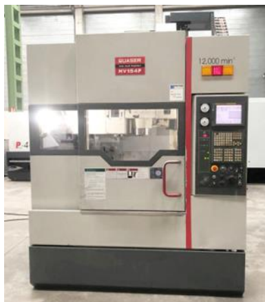
Centro de mecanizado QUASER MV-154P CNC FANUC 18i-MB. Recorridos: 760x530x560mm Cargador 24 htas, refrigeración interna y extractor QUASER MV-154P machining centre FANUC 18i-MB cnc. Travels: 760x530x560mm Tool changer 24 units, internal cooling and conveyor