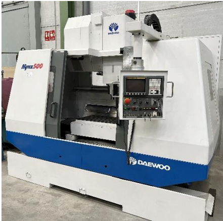
Centro de mecanizado DAEWOO MYNX 500 CNC FANUC serie 21 iM Recorridos: 1020x510x625mm Cargador RANDOM 24 htas y refrigeración interna DAEWOO MYNX 500 machining centre FANUC SERIE 21 iM cnc. Travels: 1020x510x625mm RANDOM tool changer 24 units and internal cooling