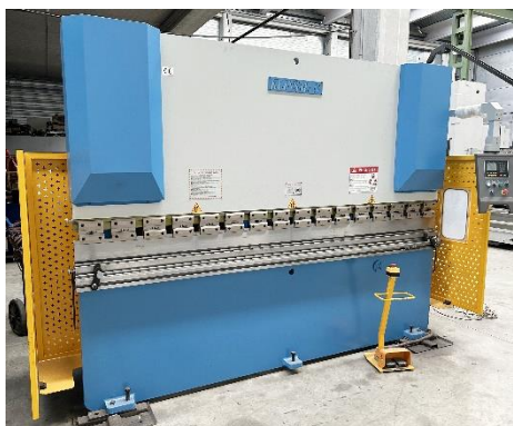
Plegadora KLINSMAN 125/3200. 3200x125 Tn Control E21 a 2 ejes. Matriz multiboca. Punzón. KLINSMAN 125/3200 press brake. 3200x125Tn E21 2-axis control. Multimouth die. Punch.