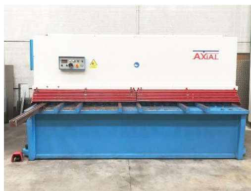
Cizalla AXIALCP 1630. 3100x16mm Con tope trasero digitalizado Hengstler, mesa de bolas, contador de cortes, iluminación línea de corte, etc AXIALCP 1630 shearing machine. 3100x16mm Hengstler digital backgauge, ball table, counter of number of cuts, cutting line lightning, etc