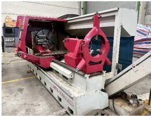
Torno cnc GEMINIS G2 1000x2000 EP 2000mm Ø bancada 100mm Ø eje principal 104mm Control SIEMENS. Extractor. Torreta SAUTER. 2004 GEMINIS G2 1000x2000 cnc lathe EP 2000mm Swing over bed 100mm Spindle bore Ø104mm SIEMENS control. Conveyor. SAUTER turret. 2004.