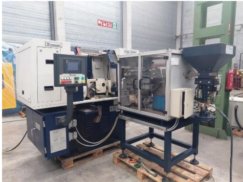
Rectificadora sin centros ESTARTA 301MV Ø máx rectificar 50mm. Ancho máx plongeé 125mm Control FANUC. Rectificado en pasante y plongeé ESTARTA 301MV centerless grinding machine Max grinding diam 50mm. Infeed grinding 125mm FANUC control. Through and in-feed grinding