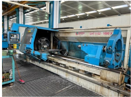
Torno cnc GEMINIS GHT5 G2 1000x3000 EP 3000mm Ø bancada 1000mm Ø eje principal 230mm Control FAGOR. Extractor. Torreta SAUTER. 2008. GEMINIS GHT5 G2 1000x3000 cnc lathe EP 3000mm Swing over bed 1000mm Spindle bore Ø 230mm FAGOR control. Conveyor. SAUTER turret. 2008