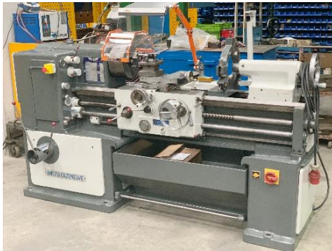
Torno universal AMUTIO CAZENEUVE HB 500 EP 1000mm Ø bancada 500mm Ø interior eje 50mm Equipado con plato AMUTIO CAZENEUVE HB 500 universal lathe EP 1000mm Swing over bed 500mm Spindle hole 50mm Equipped with chuck