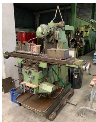
Fresadora CME FU-1E Recorridos: 950x300x450mm CME FU-1E milling machine Travels: 950x300x450mm