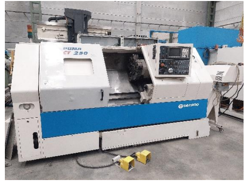
Torno cnc DAEWOO PUMA CT250 EP 650mm Ø bancada 570mm Ø eje principal 77mm Control FANUC. Extractor. Torreta 10 estaciones. DAEWOO PUMA CT250 cnc lathe EP 650mm Swing over bed 570mm Spindle bore Ø 77mm FANUC control. Conveyor. Turret of 10 stations.