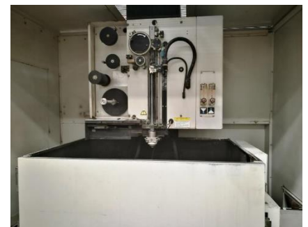
FANUC ROBOCUT ALPHA-0iB. Recorridos: X 320mm Y 220mm U 120mm V 120mm Z 180mm. Control FANUC 180 iS-W. Dimensiones pieza: 600x400x180mm. FANUC ROBOCUT ALPHA-0iB. Travels: X 320mm Y 220mm U 120mm V 120mm Z 180mm. FANUC 180 iS-W control. Workpiece dimensions: 600x400x180mm.