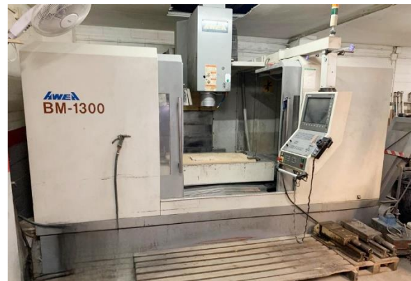
Centro de mecanizado AWEA BM-1300 CNC HEIDENHAIN 530. Recorridos: 1300x800x700mm Cargador 24 htas, refrigeración interna y extractor AWEA BM-1300 machining centre HEIDENHAIN 530 cnc. Travels: 1300x800x700mm Tool changer 24 units, internal cooling and conveyor