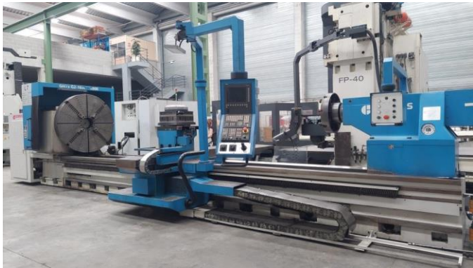
Torno cnc GEMINIS GHT9 G2 1600x6000 EP 6000mm Ø bancada 1600mm Ø eje principal 150mm Control SIEMENS. Extractor. Torreta automática. 2011. GEMINIS GHT9 G2 1600x6000 cnc lathe EP 6000mm Swing over bed 1600mm Spindle bore Ø 150mm SIEMENS control. Conveyor. Automatic turret. 2011.