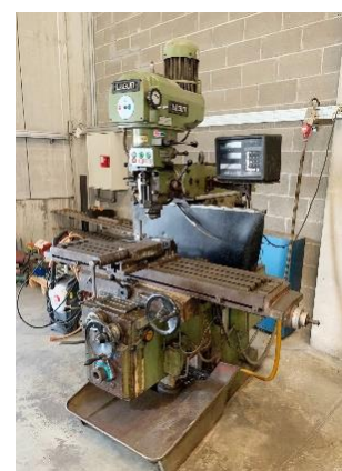
Fresadora LAGUN FTV4 con digitales Recorridos: 800x345x400mm LAGUN FTV4 with read-outs Travels: 800x345x400mm