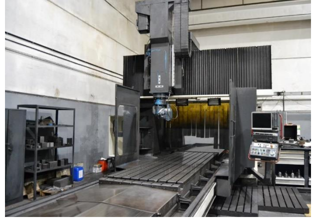
Fresadora puente NICOLAS CORREA FP 40-40 Mesa: 4500x1250mm. Recorridos: 3500x2500x1000mm Control FIDIA M2 y equipada con varias herramientas. NICOLAS CORREA FP 40-40 bridge milling machine Table: 4500x1250mm. Travels: 3500x2500x1000mm FIDIA M2 control and equipped with several tools.