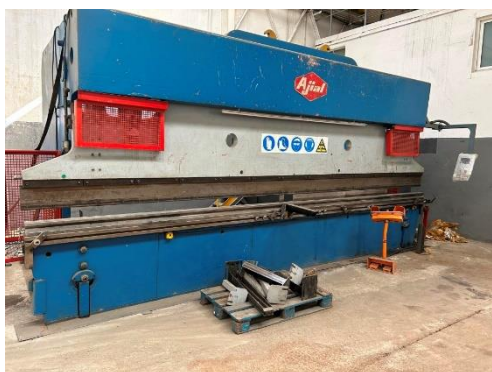
Plegadora AJIAL 2414. 6050x240 Tn Control CYBELEC CYBTOUCH 8 (2 ejes - X,Y) Mesa de compensación manual. 3 brazos. Matriz. AJIAL 2414 press brake. 6050x240Tn CYBELEC CYBTOUCH 8 control (2 axes - X,Y) Manual compensation table. 3 arms. Mouth die.