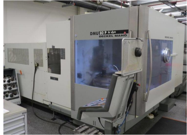
DECKEL MAHO DMU 80 P hi-dyn (5 ejes) CNC HEIDENHAIN iTNC 530. Recorridos: 800x700x600mm Cargador ATC 120 htas, extractor de virutas, sonda medición, etc DECKEL MAHO DMU 80 P hi-dyn (5 axes) HEIDENHAIN iTNC 530 cnc. Travels: 800x700x600mm ATC tool changer 120 units, chip conveyor, touch probe, etc