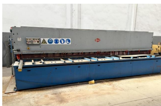
Cizalla hidráulica AJIAL CS-650. 6100x6mm Equipada con mesa de bolas, juego de cuchillas, consola, iluminación de línea de corte, etc AJIAL CS-650 hydraulic shearing machine Equipped with ball table, blade set, console, cutting line lightning, etc.