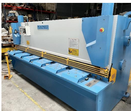
Cizalla KLINSMAN RPG3206. 3200x6mm Con control numérico E21S a 1 eje (tope trasero) Cuchillas de 4 caras y 3 brazos frontales. KLINSMAN RPG3206 shearing machine. 3200x6mm E21S numerical control 1 axis (backgauge) 4 sided blades and 3 front arms