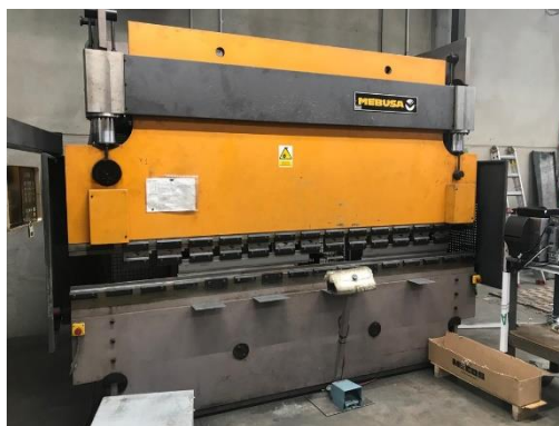
Plegadora cnc hidráulica MEBUSA SY 80/30 Control CYBELEC (3 ejes) y 5 brazos en el tope trasero MEBUSA SY 80/30 hydraulic cnc press brake CYBELEC control (3 axes) and 5 arms in the backgauge