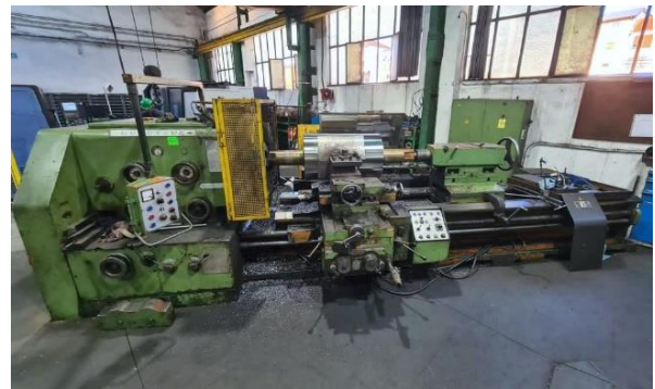
Torno universal GURUTZE SUPER BT 3000x500 EP 3000mm. Ø bancada 1000mm Ø agujero eje 102mm Equipado con plato GURUTZE SUPER BT 3000x500 universal lathe EP 3000mm. Swing over bed 1000mm Spindle hole 102mm Equipped with chuck