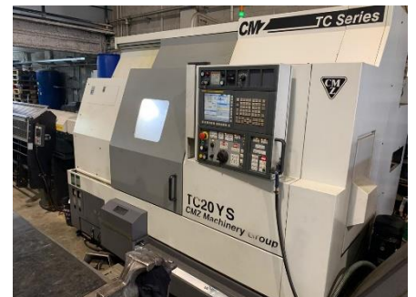
Torno cnc CMZ TC 20 YS. EP 800mm. Ø bancada 920mm. Ø paso de barra 66mm. Año 2016. Control FANUC. Extractor. Brazo de extracción de pieza. Cargador de barras automático LNS. CMZ TC 20 YS cnc lathe. EP 800mm. Swing over bed 920mm. Spindle bore Ø 66mm. Year 2016. FANUC control. Conveyor. Arm of piece extraction. Automatic bar feeder brand LNS.