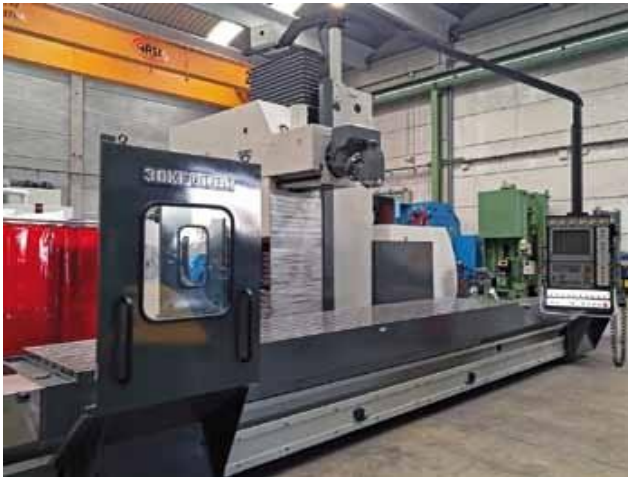
Fresadora bancada fija ZAYER 30KF-5000. CNC HEIDENHAIN TNC 426. Mesa: 5000x1000mm. Recorridos: 4710x1508x2013mm. Cabezal automático 45° (0,001°-0,001°). Extractor de virutas. ZAYER 30KF-5000 bed type milling machine. CNC HEIDENHAIN TNC 426. Table: 5000x1000mm. Travels: 4710x1508x2013mm. 45° automatic head (0.001°-0.001°). Chip conveyor.