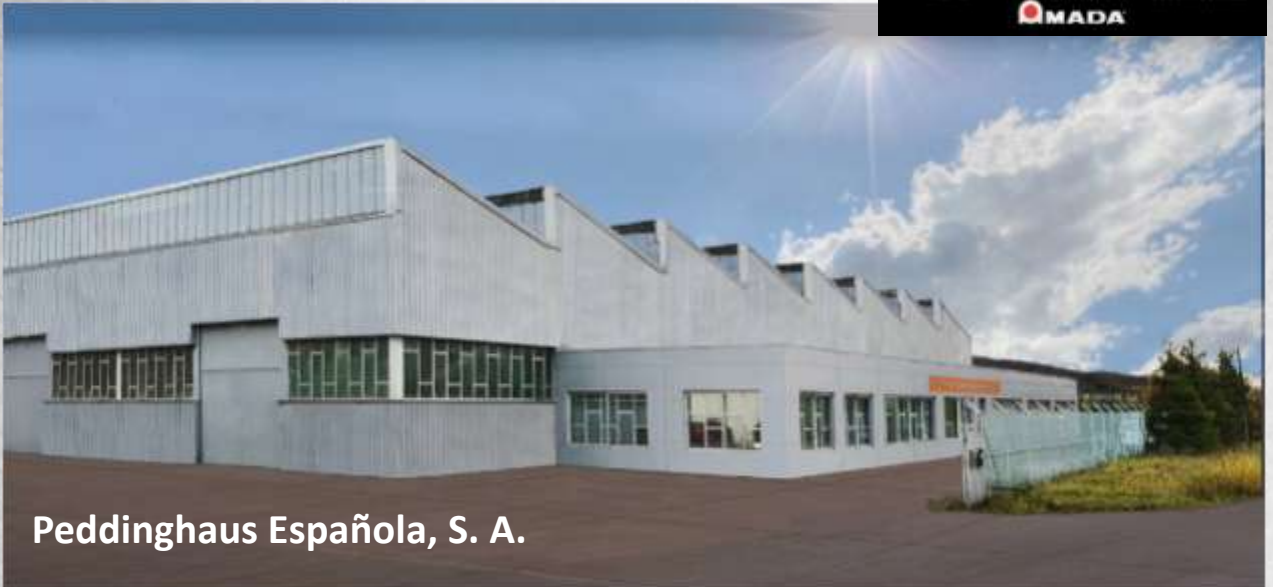
Peddinghaus Española, S. A.