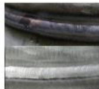
Ejemplo de uso de ECO 2 en soldadura

ECO: Decapante en pasta de aplicación con brocha sobre la soldadura, para una completa eliminación de óxidos metálicos y tintes térmicos. Mismas características que el SDINOX ECO.